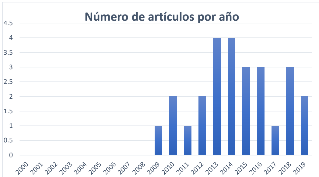
Figura 2. Número de artículos por año.